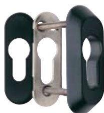
Detalle del escudo E210