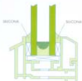
Juntas entre marco y vidrio