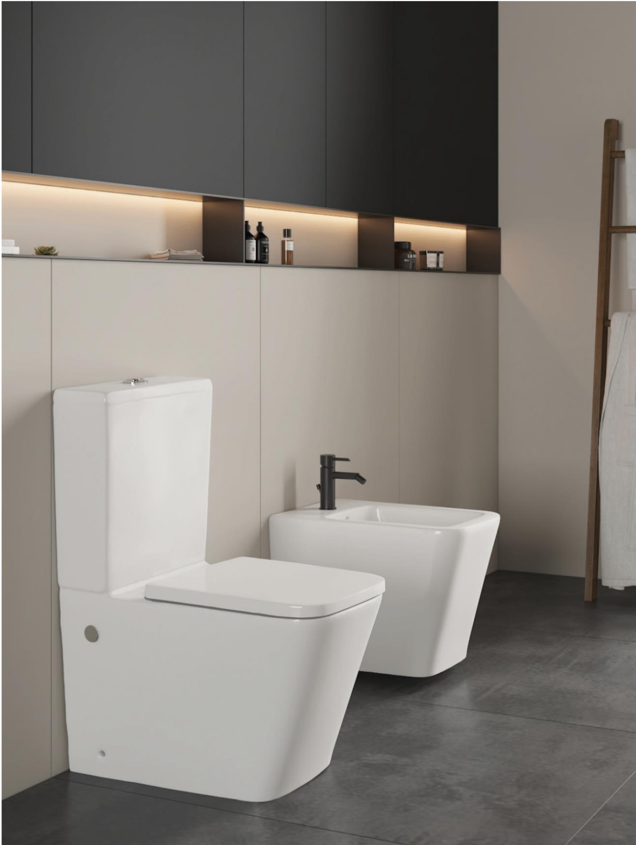
Familia 04404 – Sanitarios apolo