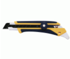
Cúter con bloqueo manual y púa multiusos L5