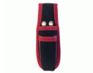
Funda universal para cutters y multiusos