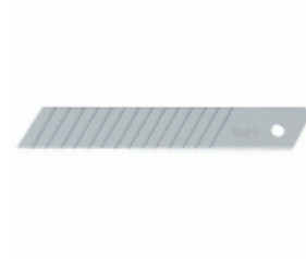
Cuchillas troceables de 18 mm con doble segmentado