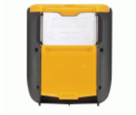
Contenedor para cuchillas usadas para cinturón o bolsa portaherramientas DC-5