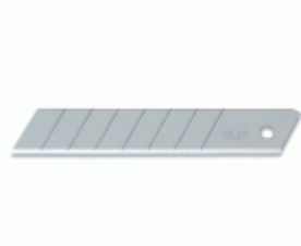
Cuchillas troceables de 18 mm en caja de plástico con clip