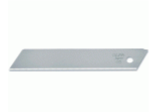
Cuchilla sólida de 18 mm