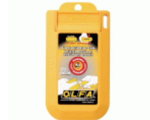
Contenedor para cuchillas usadas con tapa DC-4