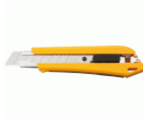
Cúter con bloqueo automático y contenedor/troceador de cuchillas incorporado DL-1