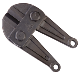
C 6009-600 Cabeza cortavarillas 600 mm / C6009600