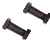
T 6009-600 M Tornillos mango cortavarillas 600 mm / T6009600M