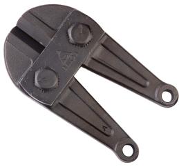
C 6009-1050 Cabeza cortavarillas 1050 mm / C60091050