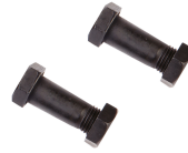
T 6009-1050 M Tornillos mango cortavarillas 1050 mm / T60091050M