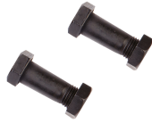
T 6009-1050 C Tornillos cabeza cortavarillas 1050 mm / T60091050C