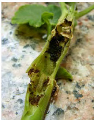
Daños ocasionados por la oruga

El ANTITALADRO LU , es especialmente efectivo para el control, tanto preventivo como curativo del taladro del geranio