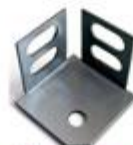
Pie metálico Metal foot / Pied métallique