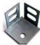
Pie metálico Metal foot / Pied métallique