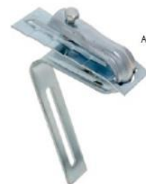
Acero Prelacado Blanco